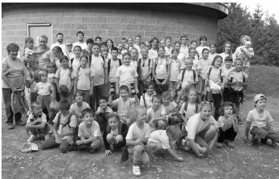
Výlet na rozhlednu Veselice Podvrší

Během 6 dnů se děti naučily nové písničky, základní kroky