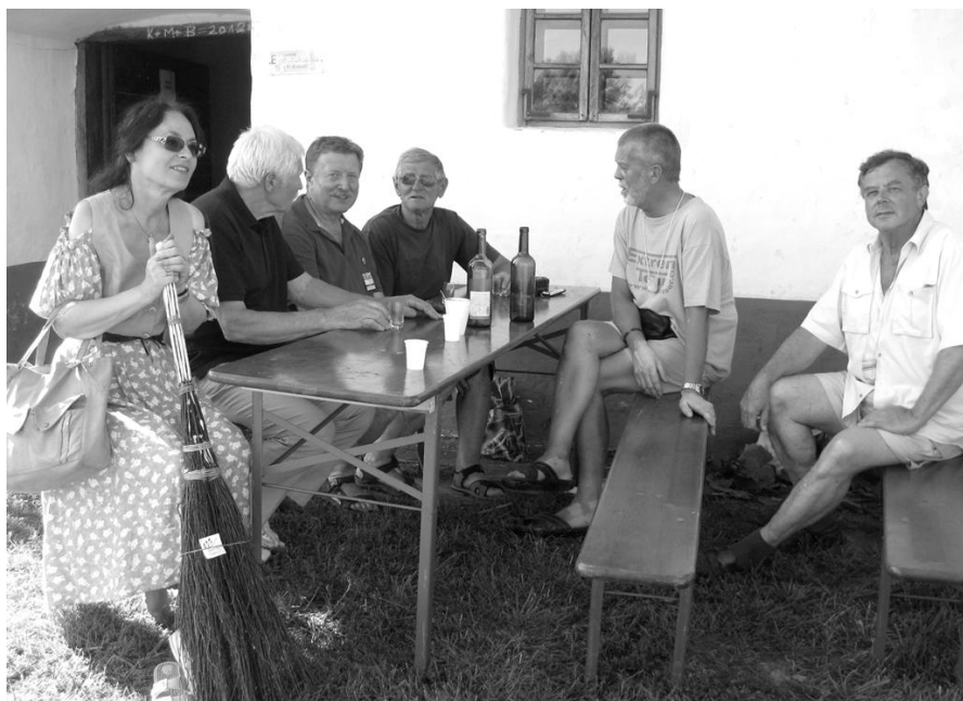
Strážnický skanzen se stal místem kumulace folklórních osobností, dobrých vín a místem pro setkávání přátel.