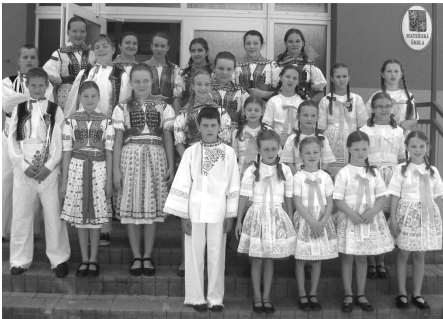
Dětský folklorní soubor Slováček v kroji