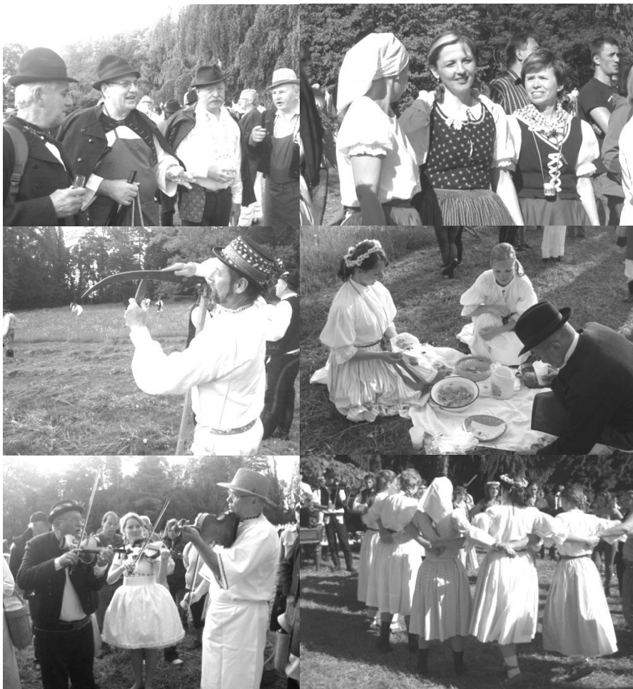
Buchlovické kosení trav bez komentáře

A teď ještě jedna fotoreportáž – tentokrát z koseckých slavností v Buchlovicích (27.5.), kam vypravil SK v Brně menší autobus - jak se povedly, posuďte sami: