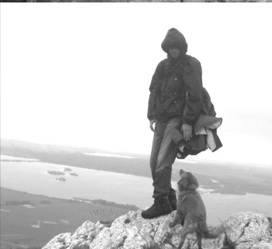
Z Pálavy 2012 - fotky dodala J. Lacinová