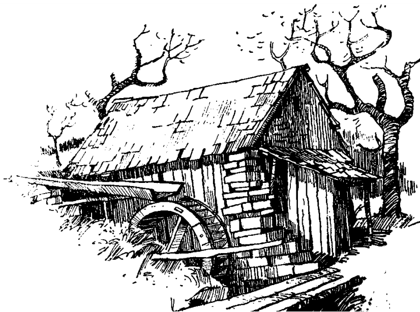
Budova valchy s pohonem na vodní kolo, Podhajský mlýn u Suchova, okr. Uh.

Úzké sepětí mezi charakterem krajiny a výrobní činností člověka se odrazilo v lidovém stavitelství ve výskytu zvláštních staveb, které sloužily ke zpracování různých produktů nebo k jiným výrobním či obchodním činnostem. Jedná se o stavby, které sloužily obvykle celé obci a často kolem sebe soustředovaly i společenský