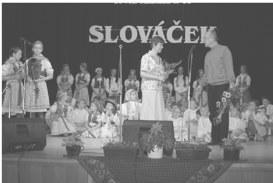
Starosta slováckého krúžku blahopřeje Slováčku k významnému životnímu jubileu