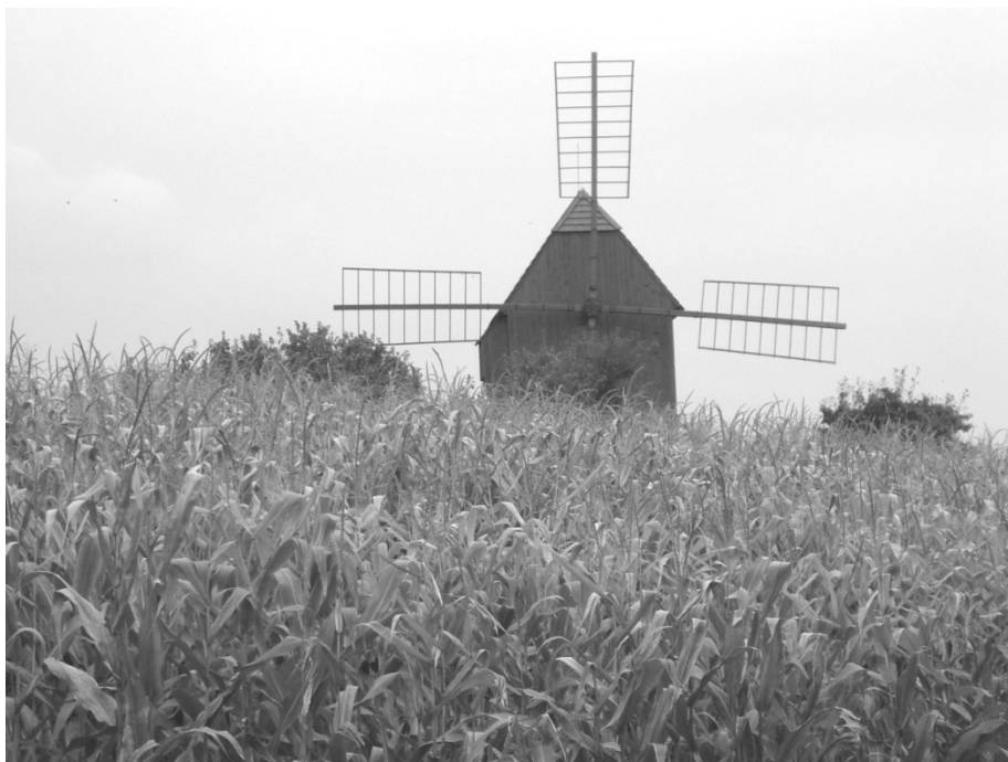
Větrný mlýn ve Starém Poddvorově