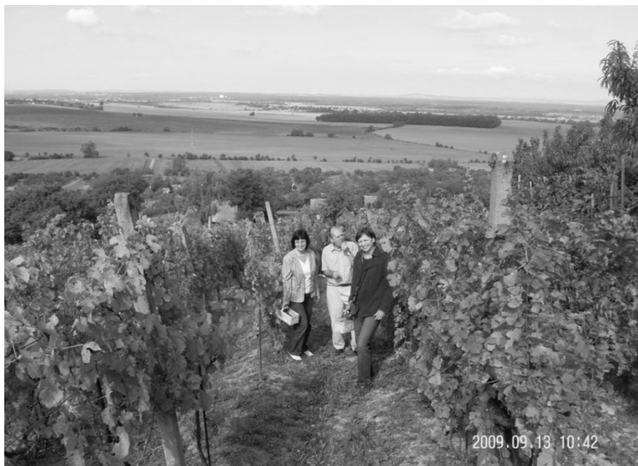
Genius loci - vinice na jižním svahu kopce Žerotín

Co to ten terroir je? Ve slovníku se dočteme, že se jedná o soubor místních vlivů na kvalitu a charakter vyráběného vína v kladném slova smyslu. Jsou to úroveň a kvalita podloží, půdní profil, místní mikroklima, druhová skladba a stáří vinic, místní zvyklosti ošetřování vinohradů, osobnost vinaře a řada dalších faktorů, které určují jedinečnost vín v dané oblasti. Rád bych ještě dodal, že právě ona jedinečnost a originalita dělá víno vínem.