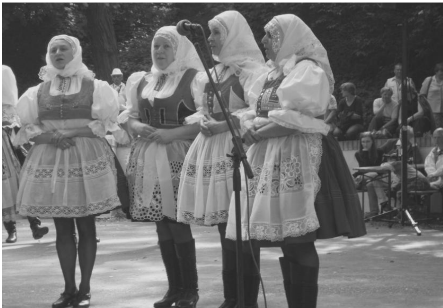
Ženský sbor Slováckého krúžku v akci.