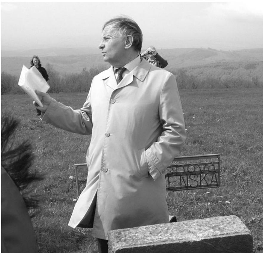
Richtár Slováckého krúžku Bratislava na Javorině.

Od prvého stretnutia našich krúžkov na Javorine uplynie v júli už 87 rokov. Z tých, ktorí sa ho vtedy zúčastnili, už dnes asi nežije nik. A predsa tu stoja nové generácie krúžkarov, aby sa vzájomne potešili a aj týmto spôsobom si vyjadrili svoje priateľstvo. Sú tu krúžkari z hlavných miest Čiech, Moravy i Slovenska, ktorí sa už možno ani v regiónoch, ku ktorým sa hlásia, nenarodili, krúžkari,