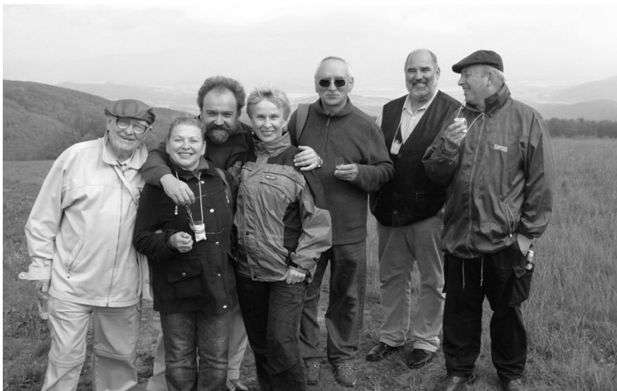
Někteří význační členové krúžků na setkání na Javorině.

Štefánik usiloval o vytvoření řídicího centra pro společný