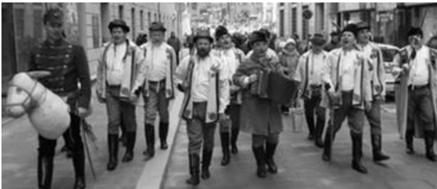
Slovácký krúžek při obchůzce v Brně