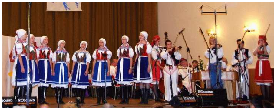
dívčí sbor a muzika Slováčku