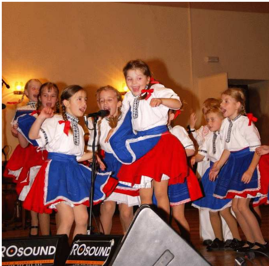
z vystoupení Slováčku