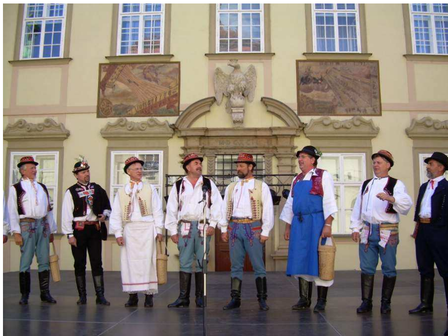
z vystoupení mužského sboru SK