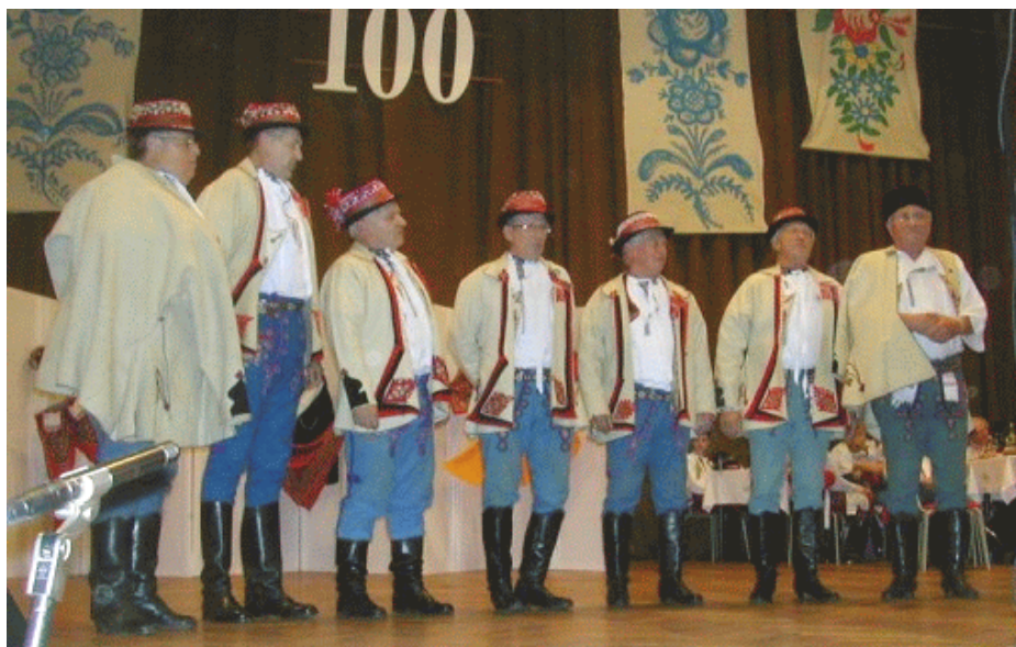
zpěváci z Hornácka