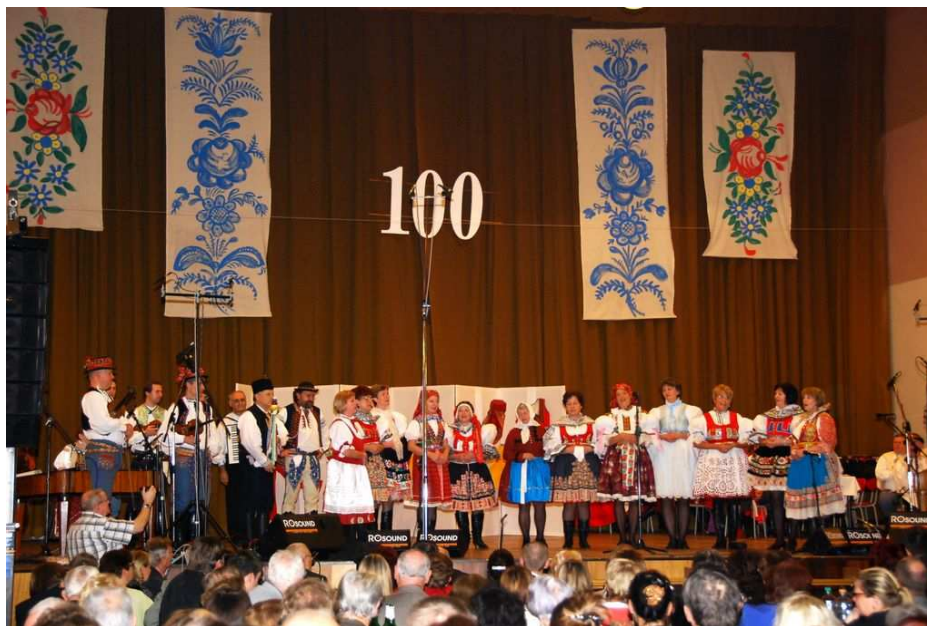
Slovácký krúžek a Skaličané z Bratislavy