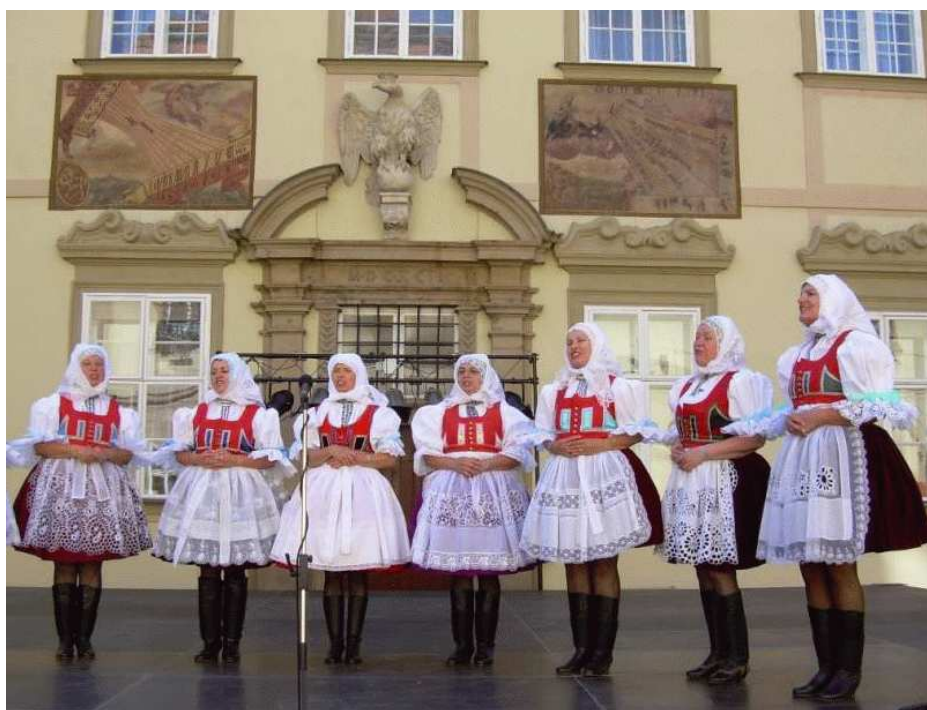
z vystoupení ženského sboru SK