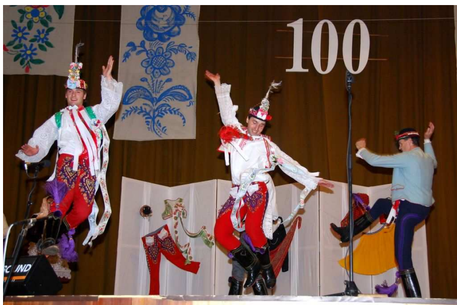
verbíři z Podluží