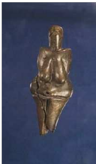
věstonická venuše z internetovské stránky muzea