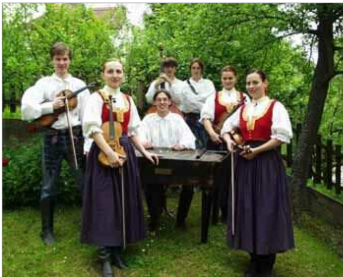
muzika Malé Zálesí z její internetovské stránky