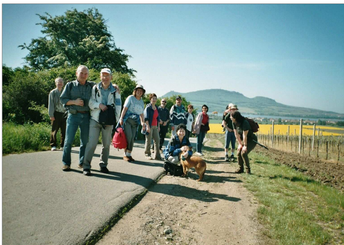
Účastníci na pozadí s Pálavou