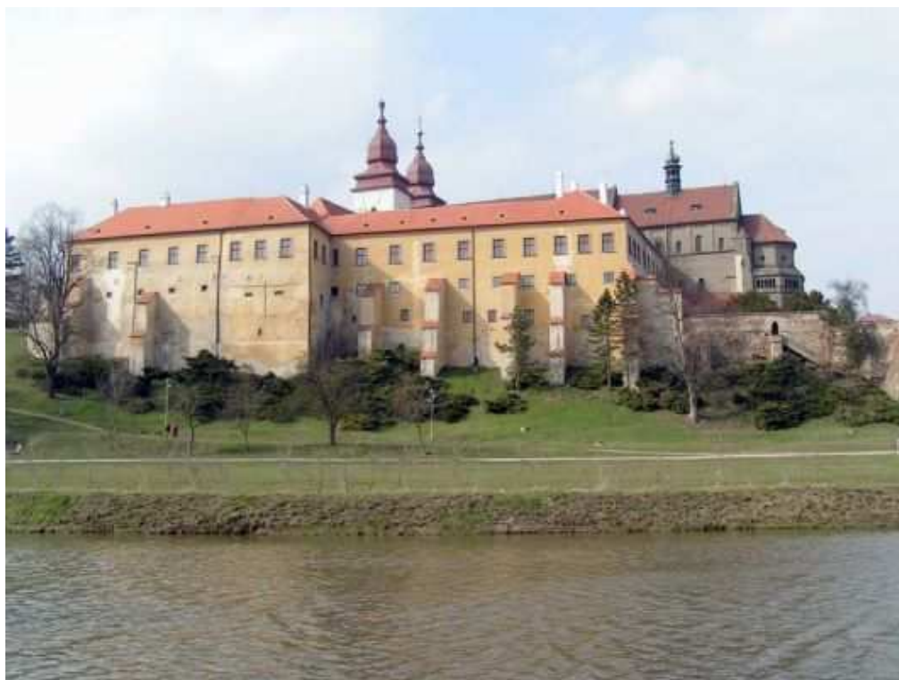
bazilika v Třebíči