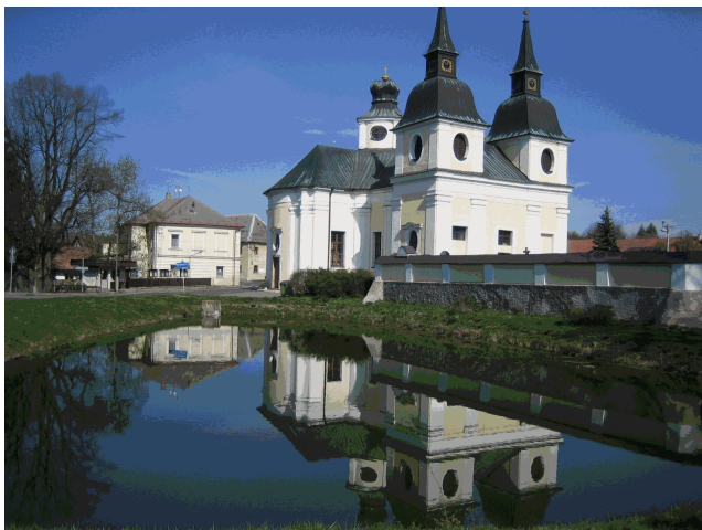
kostel ve Zvoli