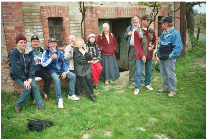
před zatopeným vinným sklepem