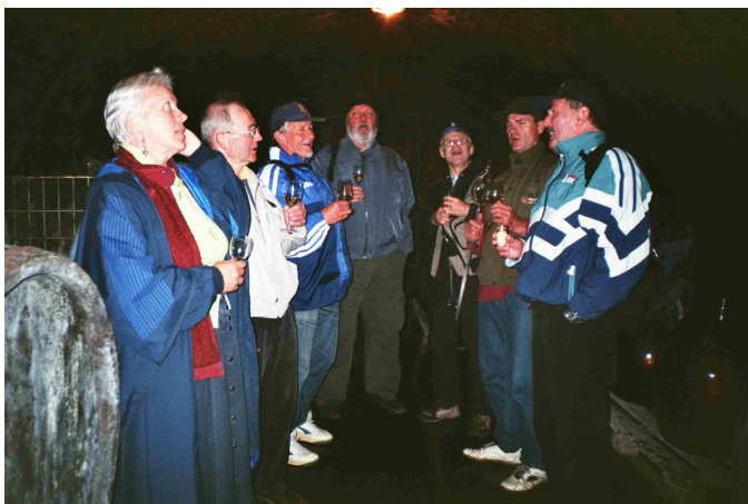
ve vinném sklepě