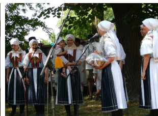
Sboreček žen z Lipova