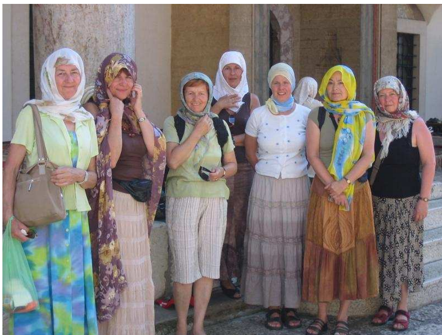
muslimky ze Slovákého krůžku v Brně