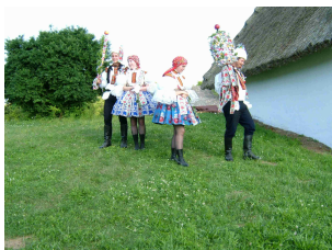
hody ve skanzenu