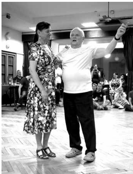
Při Sedlácké, září 2020

tím přemýšlím, že je velmi těžké těch pár řádek napsat. Důvodem není nedostatek inspirace, nýbrž její nadbytek. Jak všichni víte, Fajo je osoba velmi činorodá a sepsat jeho zásluhy minulé i současné by vydalo na celou knihu. Nezbývá mi tedy, než se omezit jen na pár vybraných.