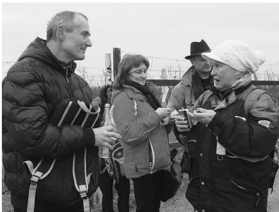
Silvestrovský špacír 31. 12. 2019