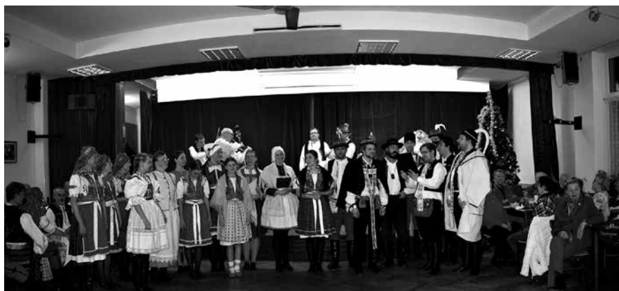
Vánoční zpívání 18.12.2019