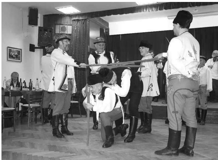
Mužský sbor při tanci „pod šable s vytináním“ ,fašaneček 2020, foto: Pavel D'Ambros

val krúžkový kalendář, který připravila chasa, tentokrát na téma krúžek a Brno, s fotografiemi různých zvyků, zasazených do brněnského městského i předměstského prostředí. Podobně úspěšná byla i beseda lednová a zejména pak Slovácký ples, jubilejní sedmdesátý. Konal se ve znamení Lipova – předtančení obstaral soubor Lipovjan a jako druhá cimbálová muzika, vedle té krúžkařské, hrála Hornácká cimbálová muzika Petra Galečky .