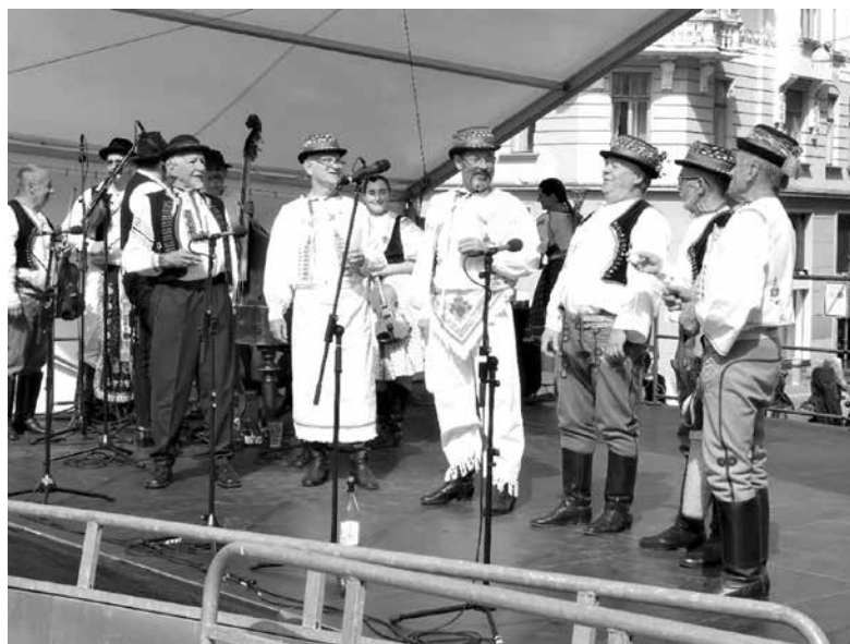
Zpěváci SK na MFF Brno, Dominikánské nám. 29. 8. 2020