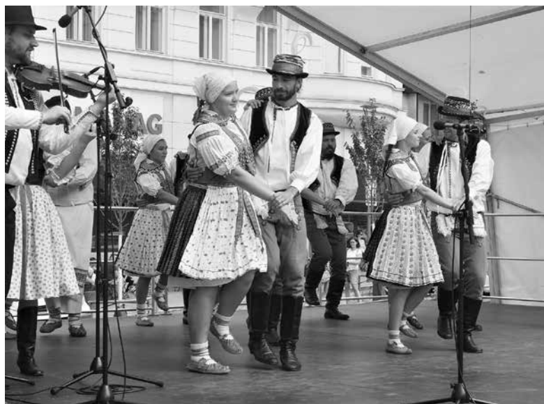
Chasa MFF Brno, Dominikánské nám. 29. 8. 2020