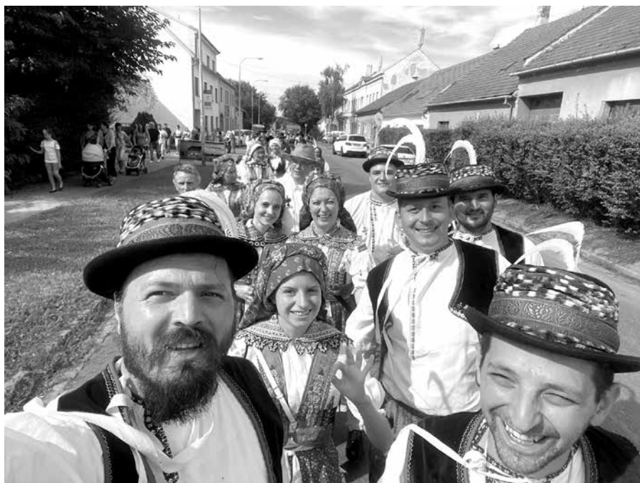
Krúžek v průvodě na hodech v Černovicích

Pokračoval Májek, po něm zazněly čardáše jako poslední vstup ŽS. Další programové bloky už jsem neviděla (chasu a Májek), moje nohy dostaly hodně zabrat a vzápětí mizím. Kupodivu jsme se u zastávky MHD sešly skoro všechny, na další program patrně zůstali jen Dostálovi a mladí. Cestu nám trochu zpestřil lehce ovíněný chlap, který si před nás dřepl skoro na zem a škemral o selfičko: „To už se mi nikdy nepovede!“ Ženské, co měly věci v klubu, nás „dvě Jany“ posléze lehce proklely: vypakovaly jsme je o zastávku dřív, zmátlo nás objíždění. Domů jsem sotva dolezla a netušila, jak vylezu z bot, propocených rukávců a rubáče. Jen mi prolítlo hlavou: to je tak, když jsou ostatní v prachu... Povedlo se bez následků.