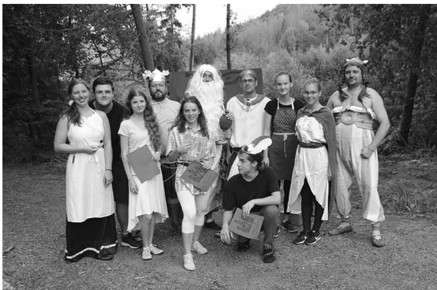
Slováckoské koronasoustředění 2020

Hlavním tanečním úkolem soustředění bylo nacvičit pásma na Mezinárodní folklorní festival. Jelikož jsme půl roku necvičili ani taneční kroky, ani paměť, začali jsme rovnou s dvěma novými pásmy. Jejich hlavní náplní bylo ukázat odchod nejstarších Slovácků do Krúžku. S pásmy nám pomohlo i několik krúžkařů, kteří s námi mohli být na soustředění celý týden. Ostatní krúžkaři se ukázali alespoň na víkend a část z nás tak přebíhala mezi nácviky Krúžku a Slováčku.