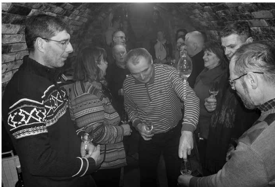
Silvestrovský špacír 31. 12. 2019