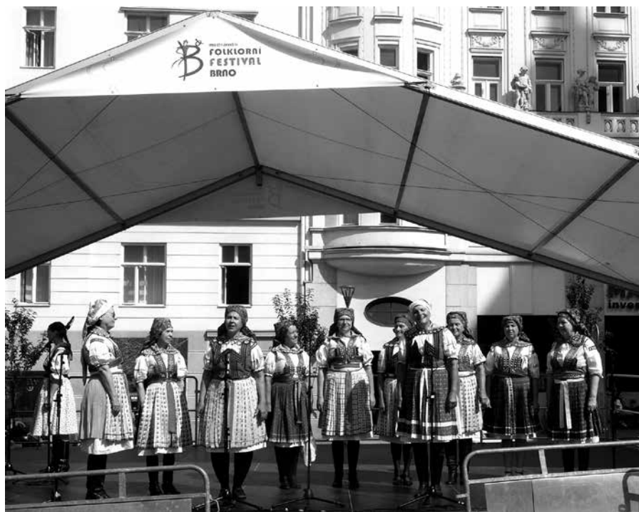
Zpěvulenky SK na MFF Brno, Dominikánské nám. 29. 8. 2020