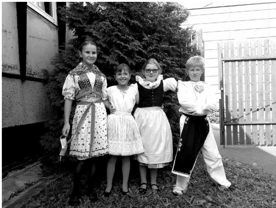
Černovického zpěváčku

ly, a v neposlední řadě smekám před p. Zelinkou, který se nebál a soutěž i přes veškerá omezení uskutečnil.