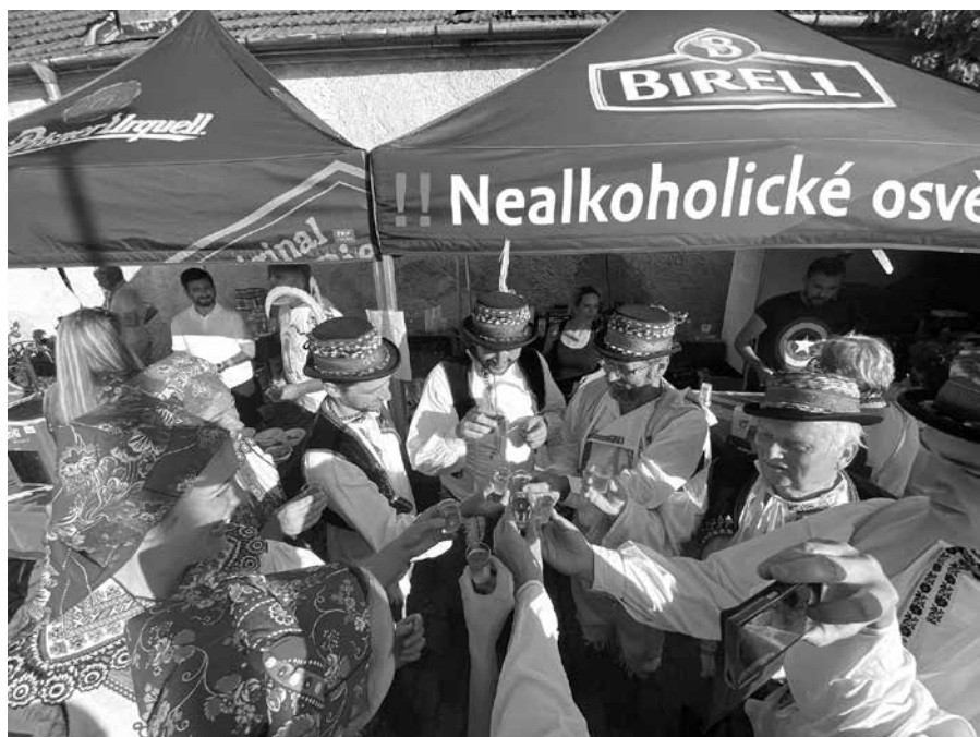
Černovické hody mají zelenou