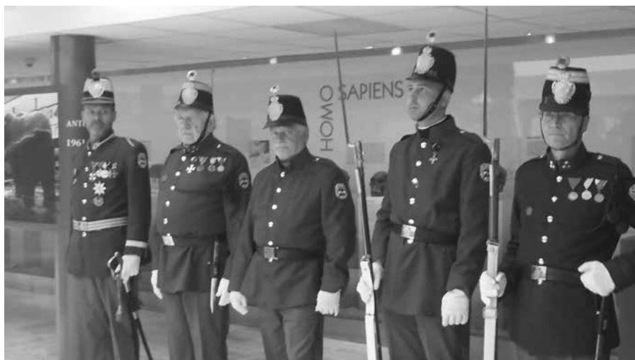
Zahájení výstavy ostrořelci C.K. Rakousko