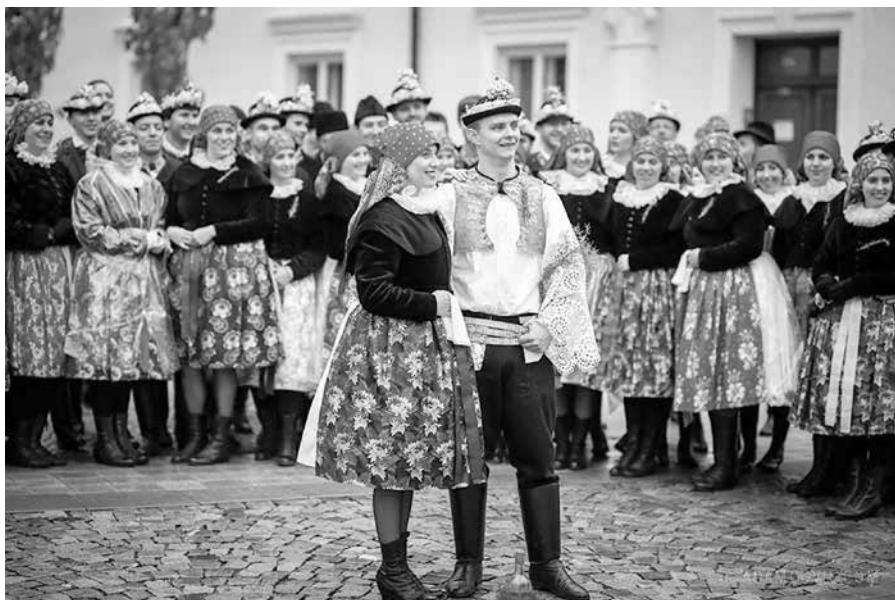
Hody ve Strážnici, foto: autor článku

ky, které kluci následně společnými silami postaví. Poté následuje zábava u muziky pod širým nebem. Proti chladu se chasa zahřívá slivovicí, dalšími destiláty a jiným občerstvením. Zábava za zvuku huslí zní často až do brzkých ranních hodin.