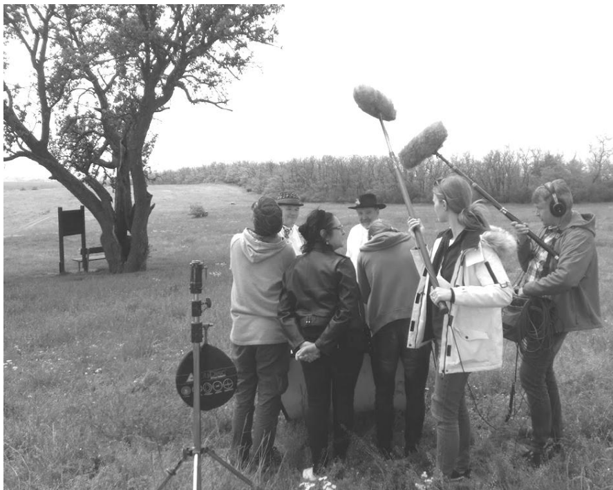
Z natáčení pořadu v krajíně nad Šumicemi