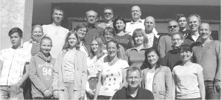
Ani po dvaceti letech nevypadají zle (setkání v září)

A už se těšíme na leden, kdy nás čeká další, tentokrát asi běžkařské setkání, zřejmě se zrodí další sloka k písničce „Jedou, jedou běžkaři, od huby se jim paří ...“ Tak všem třicátníkům zdar a těm po 20 letech obzvlášť.