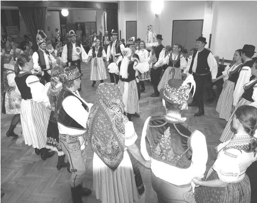
Kolečko po povolení hodů

V hodovou středu, která připadla na 16. října, naše chasa předvedla průvod, který můžete právě na dolněmčanských hodech vidět. Prvně jsme si vyzvedli mladšího stárka, který si zašel pro mladší stárku, a průvod poté pokračoval ke staršímu stárkovi a stárce.