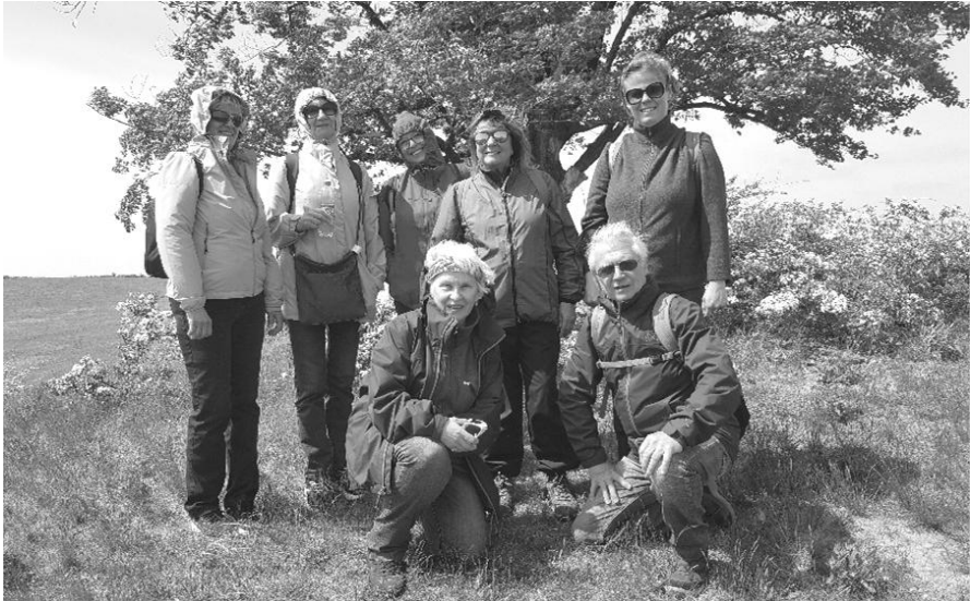
„ Malí sirotci“ v nádherné krajině CHKO Dunajovické kopce