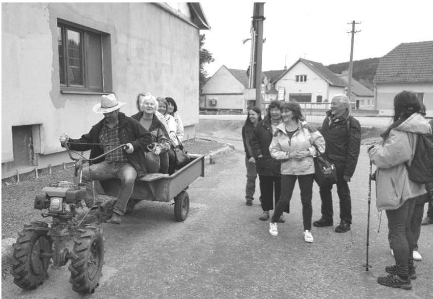
Nasedli jsme na pomaloběžný traktor „Buldock“....

Všichni víme, že nejen folklórem živ jest člověk. Mám za to, že když se spojí takzvané „dění folklórní“ s tím osobním, je to úplně nejlepší. Skloubit oslavy a zpívání všeho druhu se nám docela daří.