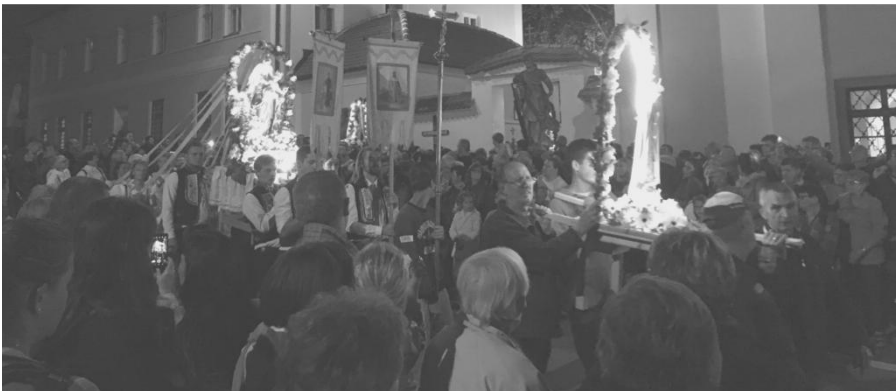
Večerní průvod měl nezapomenutelnou atmosféru