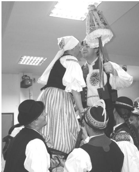
Sólo pro paní starostovou