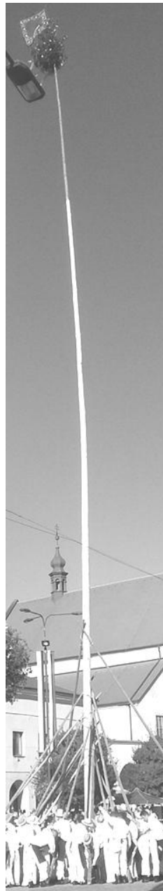
Stavění máje Kyjov

Pokusím se nyní krátce okomentovat programy, které jsem viděl. Tak jako obvykle,