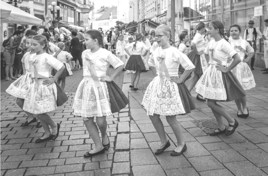
Roztančené město a roztančený Slováček