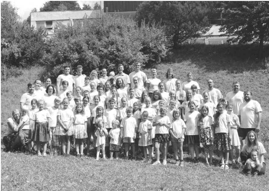
Děti Slováčku na společné fotce v Nedvědici

konci nácviku jsme většinou už všichni odpočítávali poslední minuty do oběda i do následného poledního klidu. Co ale bylo pro děti ještě lepší než polední klid, byl bazén. Jaké by totiž bylo soustředění Slováčku bez nadšeného křiku dětí u bazénu a neustálého strachu vedoucích, že se dětem něco stane? Doufám, že to nikdy nezjistíme.