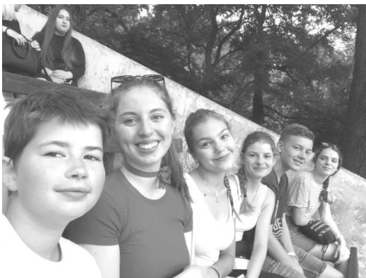
Odvážlivci ze Slováčku ve Strážnici tentokrát jako diváci

V kempu jsme postavili stan, vybalili si těch pár věcí, co jsme měli, a zamířili do areálu. První, co jsme museli navštívit, byly samozřejmě stánky s jídlem. Zároveň se tak staly naším nejnavštěvovanějším místem po dobu trvání festivalu. Při brouzdání po jednotlivých amfiteátrech jsme potkávali kamarády jak z krúžku, tak ze Slo-