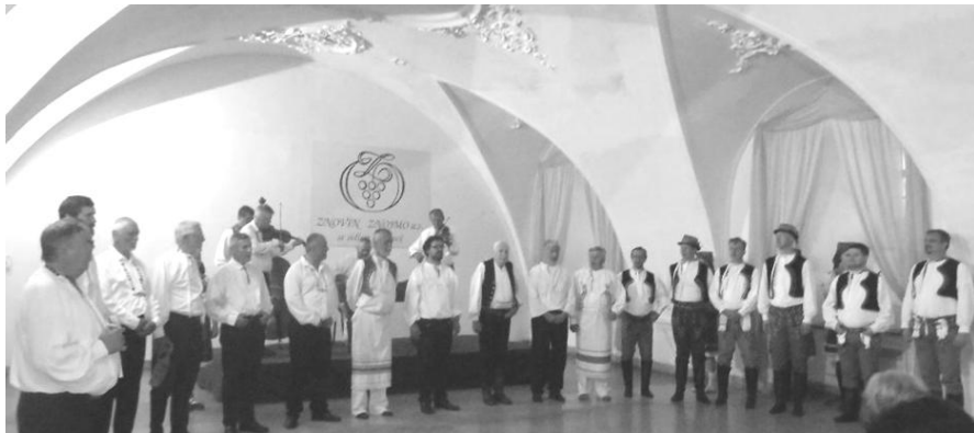
Hostitelský soubor pražského krúžku v štukovém sále Znovínu

Všem členům pražského Slovákckého krúžku patří velký dík za vzorně připravenou akci a mně nezbyává, než říci – brzy na viděnou.