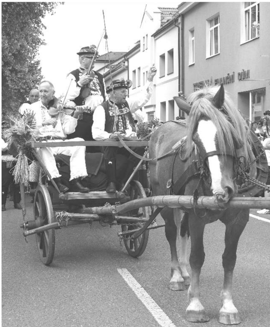
Ze slavnostního průvodu v Kyjově