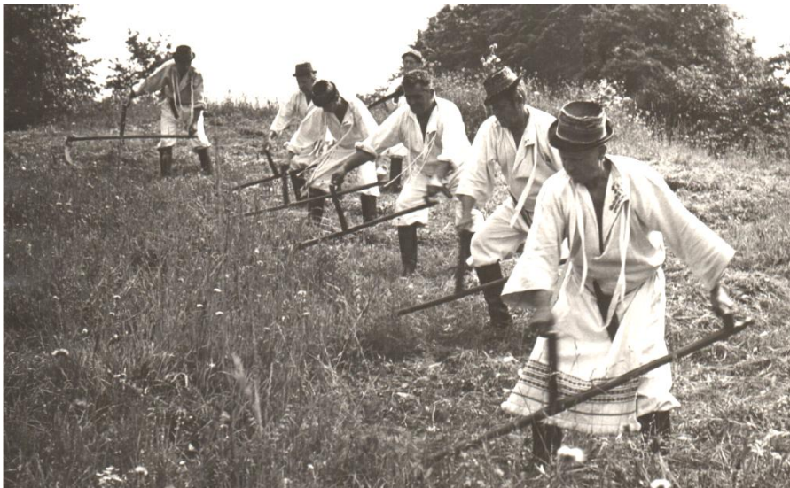
Kosení trav na Horňácku

„Hrochoťská dolina, šak si rozvlečená, veru ťa neprejdem ani do večera...“