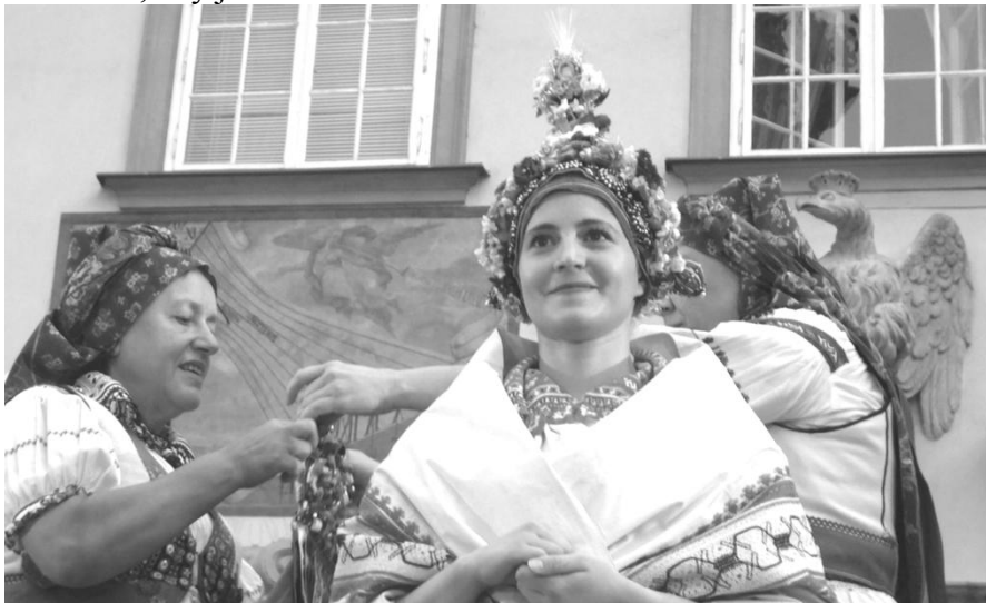
Čepení nevěsty v pořadu „Podoby lásky“ na Nové radnici

jí jedna z žen uvázala slavnostní čepec a šatku dole koncem. Celá skupina pak nevěstu vyprovodila ven, kde už na ni čekala skupina chlapců a mužů a snažili se ji unést, nebo alespoň nedovolit ženichovi, aby ji získal zadarmo.