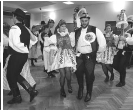
Hody 15.10. sice rychtář (Fajo) povolit nechtěl, ale musel