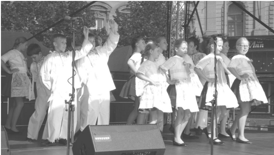
Děti Slováčku na MFF Brno 2019