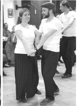
Beseda 15.5. - chasa předvádí tance z Dolního Němčí a Hanýžka slaví své kulatiny