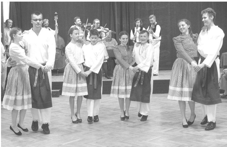
Slováček se na besedě předvedl v nejlepším světle

Na veselské došlo i později, na besedě, kde jsme si je společně s ostatními moc rádi zopakovali. Bylo vidět, že tanečníci si vše, co se naučili, zapamatovali a neváhali svoje znalosti ukázat. My jsme jen spokojeně sledovali, jak celý sál hýří naším oblíbeným tancem.