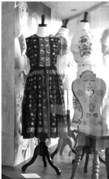
Pohled do expozice výstavy

abstraktní pojmy jako „vlast“, „národ“ byly s jejich pomocí zpředmětněny, převedeny do hmatatelné tj. uchopitelné podoby.