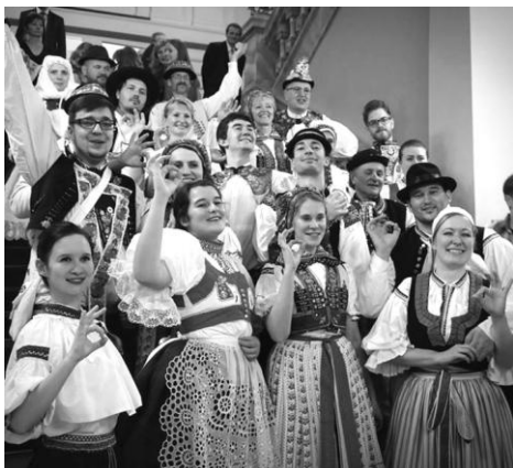
Naše rozjařená chasa na Žofině

Naši výpravu jsme zahájili v sobotu o půl čtvrté odpoledne, kdy jsme vyrazili autobusem směr Praha. Ne úplně krátkou – a příznějme si to otevřeně, na českých dálnicích ani ne přímo příjemnou – cestu jsme si vylepšili řadou písní a do hlavního města naší republiky jsme dorazili správně naladěni.