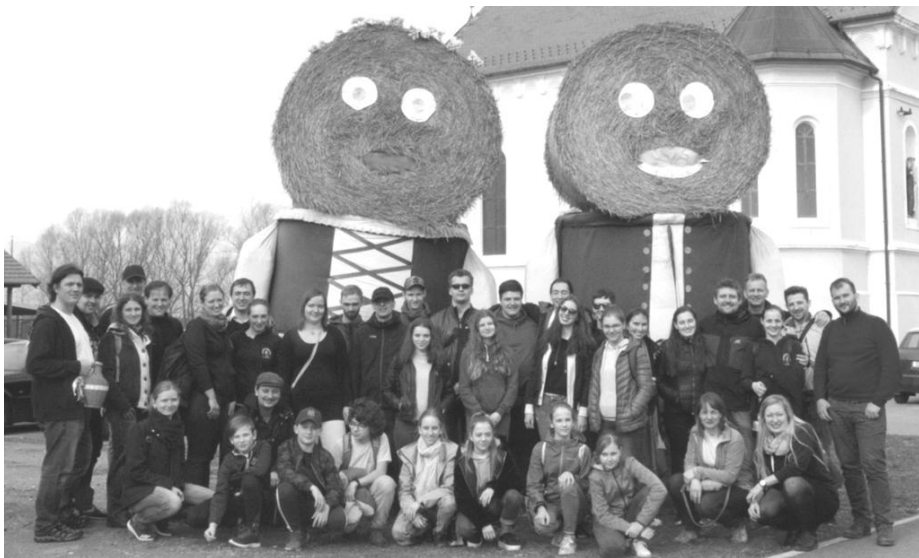
Účastníci zájezdu v Chorvatském Daruvaru

Ještě jsme ani nevydechli z fašanku a už jsme balili na společný zájezd taneční složky a Slováčku do chorvatských měst Končanica a Daruvar. V těch sídlí česká menšina, která na své kořeny nezapomíná