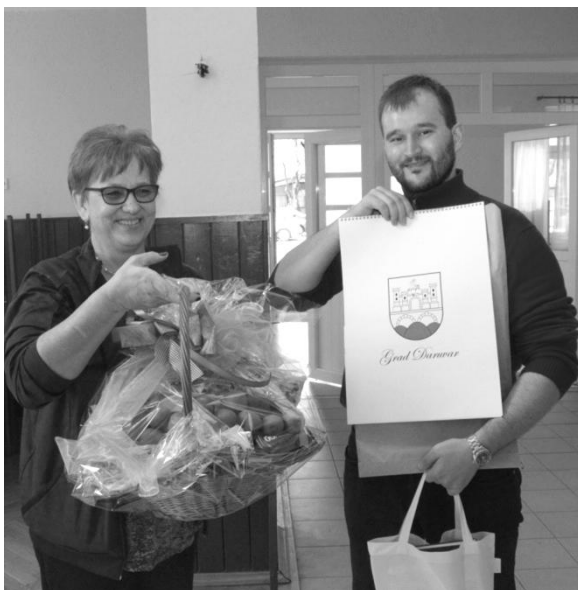
Předání darů od české menšiny v Darubaru

Po výuce jsme se krátce občerstvili a utíkali se připravit na hlavní bod programu, jakýsi „galavečer“. O pódium v končanic-kém Českém domě jsme se podělili nejen se Slováčkem, ale i s účinkujícími z místních českých besed, kteří nadále udržují české písně a tance. Z naší strany mohli diváci spatřit mimo jiné právě ty tance, které jsme je před pár hodinami v tělocvičně učili. Zazněly proto veselské a straňanské