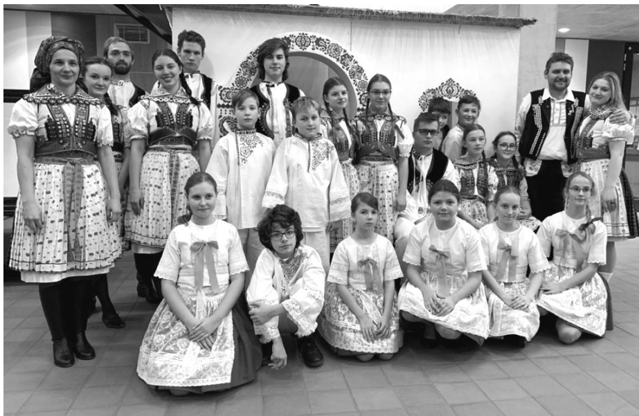
Vyšňorený Slováček na plesu v Ratíškovcích

Na plesu spolu s námi účinkovaly děti, které se schází v družině