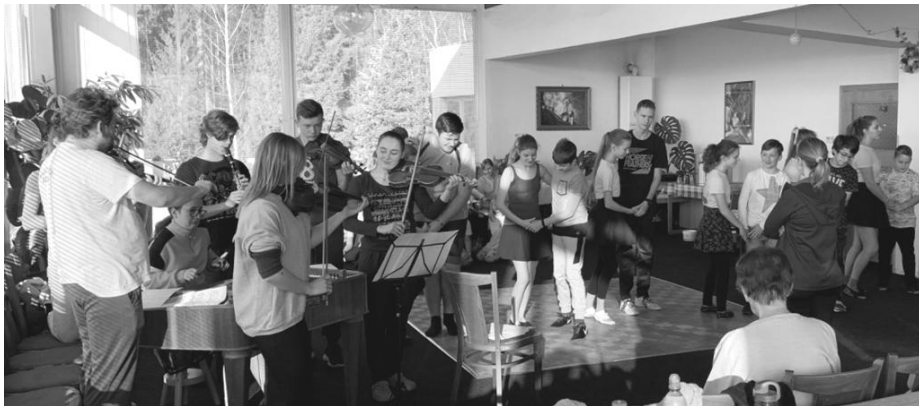
Slováček na soustředění v Nedvědici zkouší