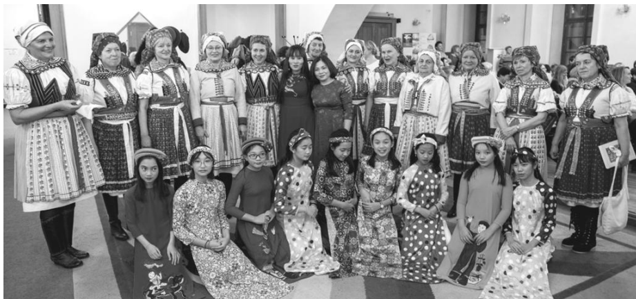
Ženský sbor spolu s vietnamskými dětmi při vernisáži knihy v Ditrichštejnském paláci při křestu knihy