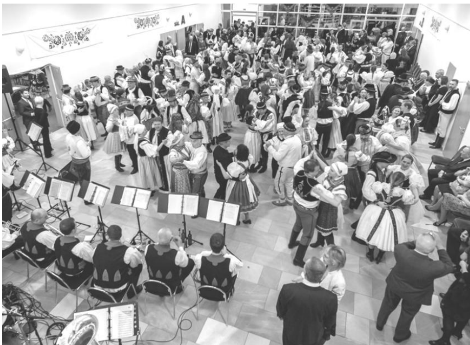
69. Slovácký ples

Jako důkaz naplnění vize krojovaného plesu přikládám fotografie od pana Tomáše Cigánka, který nám pořídil mnoho krásných fotografií, které stojí za zhlédnutí a za které mu velmi děkujeme.