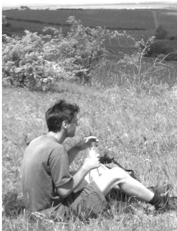
Botanik Ondřej v akci

Dne 8.5.2018 se zlaté jádro Slováckého krúžku složené z nejmenovaných členů vydalo v hojném počtu deseti lidí z Brna do Brodu nad Dyjí vstříc přírodopysným zážitkům a pohostinnému sklepu Zdeňka Bravenec v Dolních Dunajovicích.