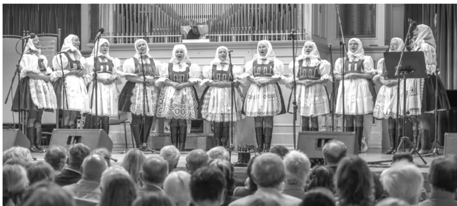
Ženský sbor Krúžku