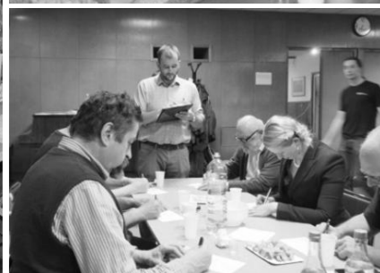
a hodnotící komise to braly vážně i nevážně, ale zvládnout to nebylo lehké.