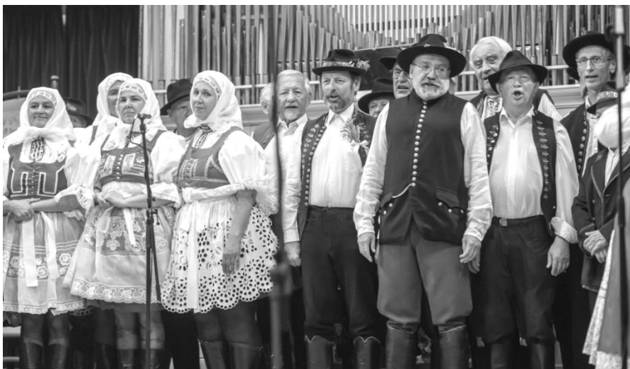
„Landava“ – spojené mužské sbory Slováckého krúžku v Brně, mužských sborů ze Žatčan a Líšně a ženský sbor Krúžku

Písně z Hanáckého Slovácka svým charakteristickým hlasem