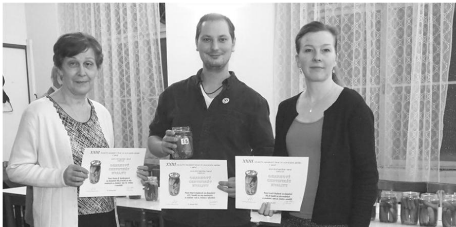
Vítězové oharkového šmaku v záplavě oharků

všech vzorcích se úderem desáté, kdy byla vyhlášena volná konzumace, doslova zaprášilo.