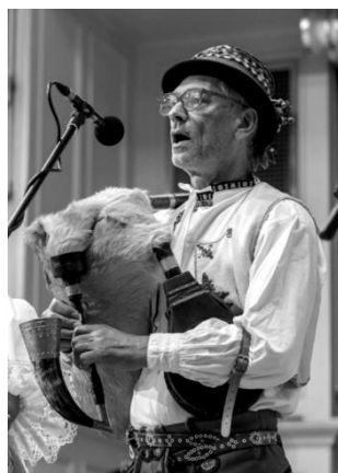
Ovšem největší sláva byla na koncertě k poctě F.Sušila