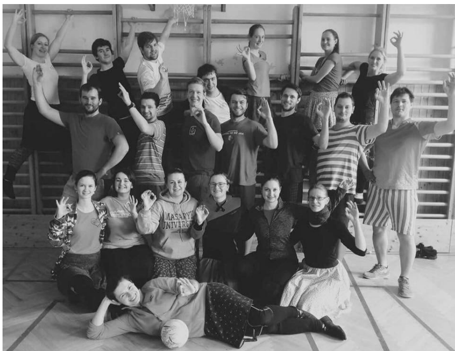
Chasa při soustředění v domanínské Orlovně

Sobotní dopoledne jsme věnovali figurálním tancům z Uherskobrodsko, u kterých má každý pár ze šestice tvořící útvar vlastní pozici a úlohu, takže nás logistika tohoto pásma vcelku potrápila. Tu více, tu méně, ale z globálního hlediska si troufám říct, že jsme na ni vyzráli.