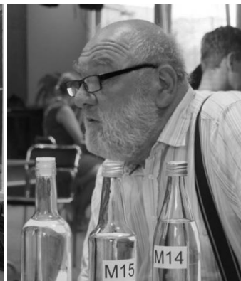
přišla slivovice v dubnu