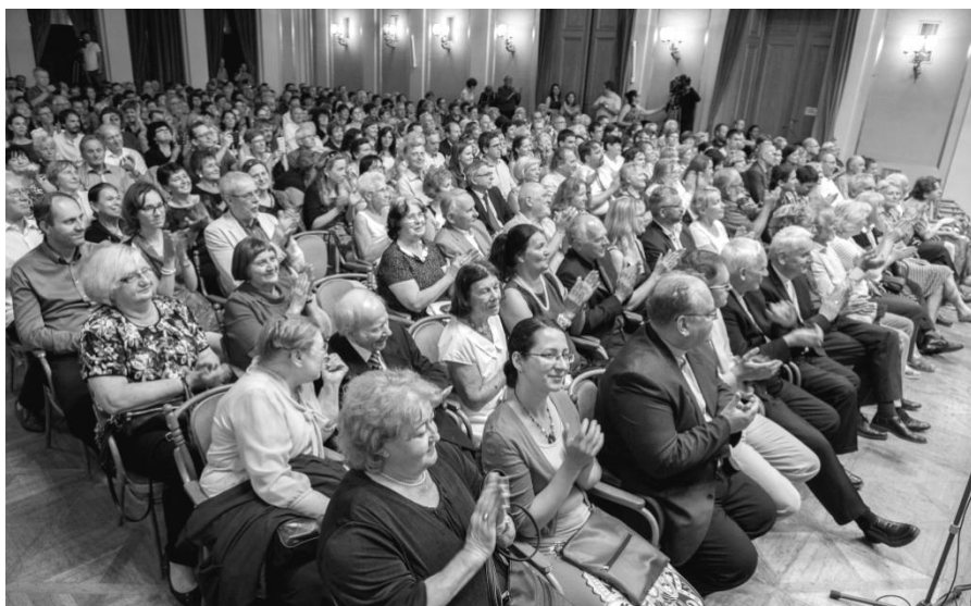
Nabitý sál Besedního domu 1.6.2018