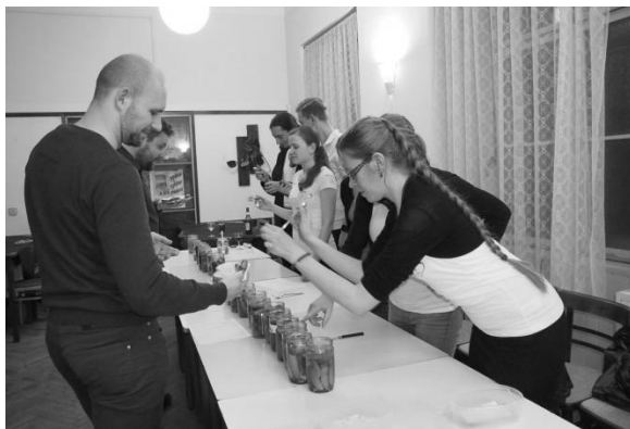
Po oharkách v březnu