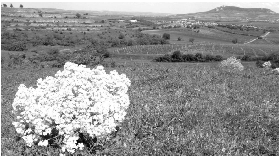
Katrán tatarský, v pozadí D.Dunajovice a Pálava

Jsou to bílé keříky příbuzné řepce (v tomto případě se ale Babiš nijak neangažoval). Z dálky vypadají jako stádo huňatých oveček na pastvě a na rozdíl od nich krásně voní. Po dokvetení uschnou, vítr je utrhně a katrány se kutálí po stepi vytrásající semena jako tzv. "stepní běžci" společně s máčkou ladní. O kousek dál nacházíme skutečné ovčí a kozí stádo. Nejlepší způsob udržování lučních společenství je mírná pastva.