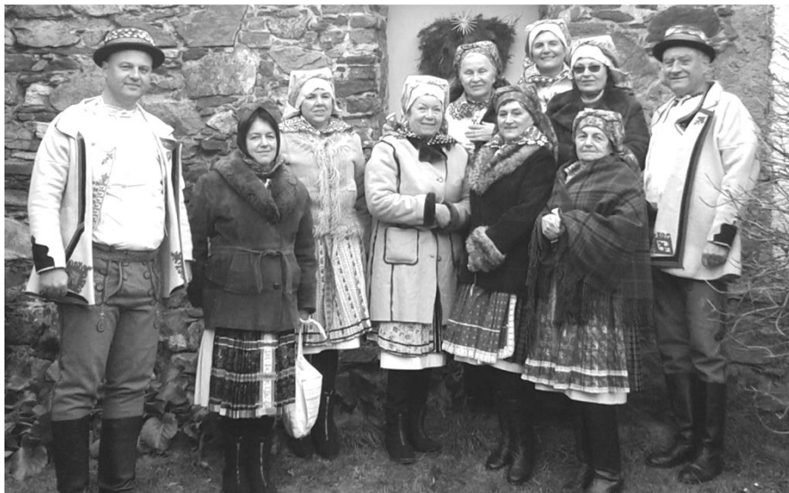
Březina, advent 2017

gala v patře Obecního úřadu, osazenstvo vozu J. Tolara už vesele dlabalo zelňačku... Nám to nevyšlo, je čas tak akorát na pozdrav, neb paní domácí nás dnes lifrovala k produkci už ve 13.30. Víme, že máme zpívat zhruba hodinu. Pěkně přituhlo, kožíšky i vlnáky jsme nahodily, ale bude to slušný nářez. Střídající parta muzikantů chybí, o zpestření se postarají děti z mateřinky, ovšem až ve tři.