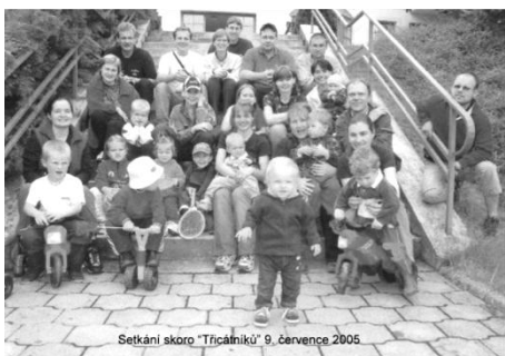
Setkání skoro "Třicátníků" 9. července 2005.