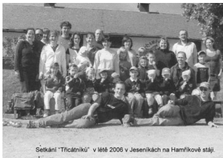
Setkání "Třicátníků" v létě 2006 v Jeseníkách na Hamříkově stáji.