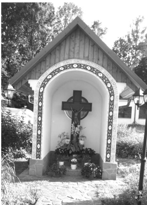
Zdobená kaplička ve Vápenici

Na kraji vsi v prudkém svahu stojí pěkná udržovaná kaplička vybavená dvěma menšími zvony. Vejde se do ní odhadem patnáct lidí. Ve