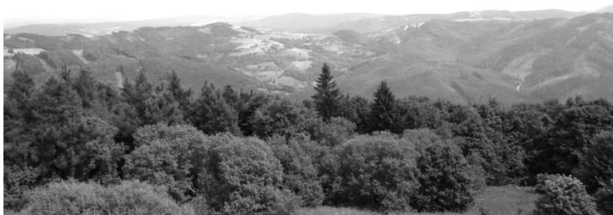
Pohled z Velkého Lopeníka na slovenskou stranu

Nyní jsme konečně mohli vyrazit na další etapu naší cesty přes přírodní rezervaci Nová hora s nádhernou luční kulturou, s pokračováním sestupem k Starým Dílům u Březové, poté opět nahoru na Velký Lopeník. Odpoledne jsme pokračovali hřebenem na Mikulčín vrch, odtud po silnici k rozcestí pod Vyškovcem a etapu