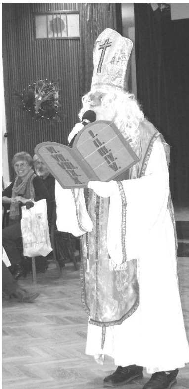
Mikuláš – Ujo Fajo

Návštěvníci besedy sledovali program s pobaveným výrazem, dost často si na nás i ukazovali, ale my jsme se snažili program dovést až do zdárného konce, kdy jsme natruc Mikulášovi zatančili jako čerty i andělé hravý kankán. To již některé z návštěvníků