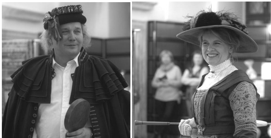
Z přehlídky historických modelů 1. 12. 2017 v Paláci šlechtičen