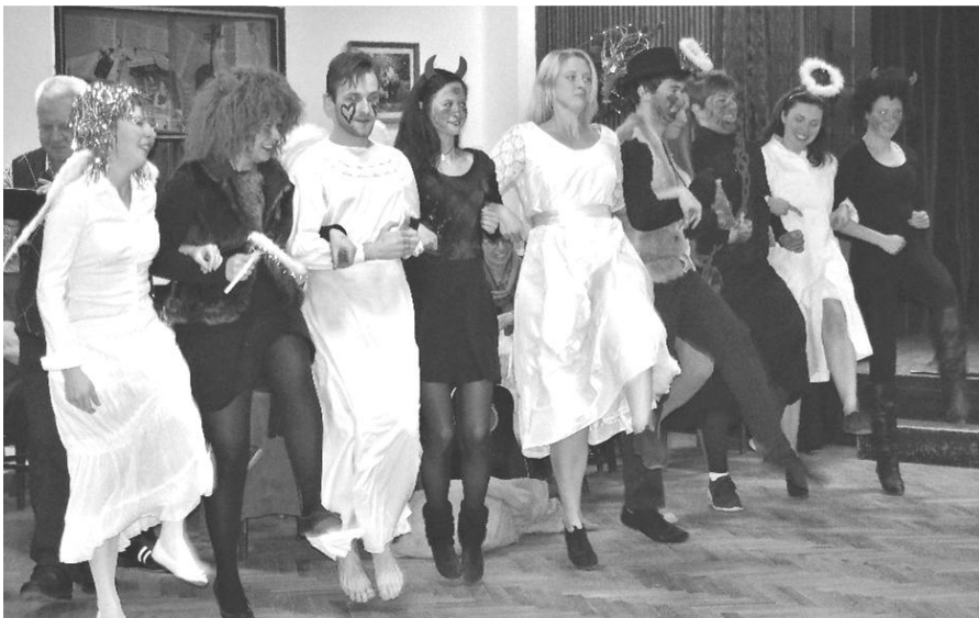
Kankán v podání andělů, čertů a čertic z chasy

přepadaly otevřené výbuchy smíchu a možná tak došlo k ukončení přemítání o stavu celého lidstva.