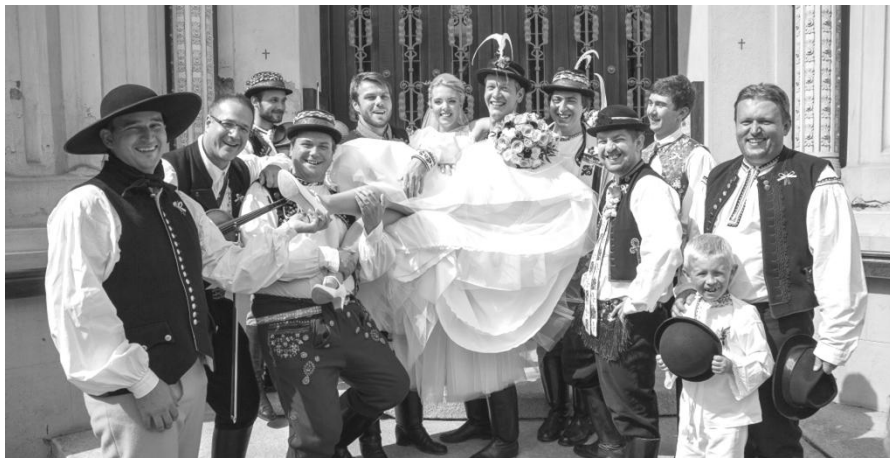
Nevěsta nesená chasou

Velký dík patří všem krojovaným, kteří se pečlivě připravovali a předvedli nejen krásné a různorodé kroje, ale také připravené scénky a písničky na nápěv písně: „ Na Okoř je cesta“ speciálně upravené pro nás, novomanžele. Měli jsme z nich velkou radost!