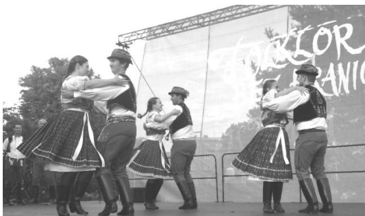
Chasa v Ostravě

Většina festivalů se koná od čtvrtka do neděle. Ne tak ostravský "Folklór bez hranic". Pořadatelé zřejmě vycházejí ze