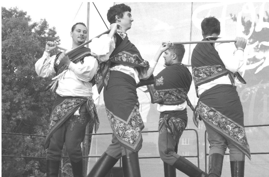
Bobkovníci v podání chasy