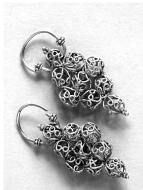
Zlaté náušnice z VM

V 6. století sice přišli do naší země první Slované, nedali jí však jméno, protože již jméno měla. Nikoli od předcházejících Germánů, ale od ještě starších Keltů, kteří řece svým jazykem říkali Mórahva, tedy něco ve smyslu Močalovitá voda, Močalovitá řeka. Nepochybně šlo o odkaz na rozsáhlé, řekou zaplavované lužní lesy, které ji obklopovaly. I po příchodu Slovanů představovala řeka veledůležitou dopravní a obchodní tepnu, protože řádné cesty, snad krom několika hlavních, v těch dobách vlastně ani nebyly. A tak dala řeka jméno i celé zemi, byť humanističtí učenci jméno Morava rádi, avšak mylně odvozovali od germánského kmene Markomanů.