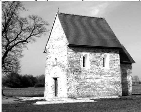
Kostel sv. Margity u Kopčan je jediná spolehlivě stojící stavba z doby Velké Moravy

Oba měli mnohé zkušenosti, mladší Konstantin zastával úřad chartofylaka při úřadu patriarchy a byl mimořádně vzdělaný v teologii, filozofii a jazycích, starší Metoděj působil dříve jako správce oblasti obývané Slovany nad Soluní, měl právnické vzdělání, pak ale světskou kariéru pověsil