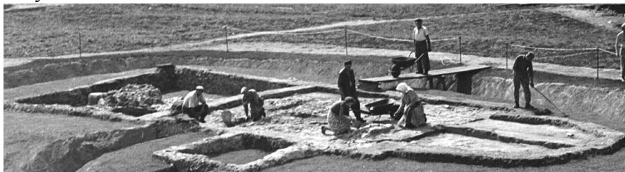
Odkrytí základů křesťanského kostela, Pohansko

dřevěná stavba, vyučovali oba bratři a pak sám arcibiskup moravské žáky.