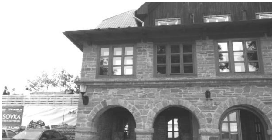
Holubyho chata na Velké Javořině

kněze, badatele, přírodovědce a národopisce, zastávce česko-slovenské vzájemnosti, který mj. poprvé popsal květenu na území Malých Karpat.