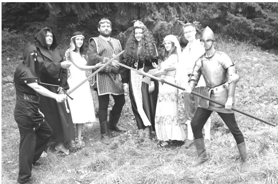
Královská rodina - nikoliv skupina historického šermu, ale vedení Slováčku v Nedvědici

Každoročně se druhý srpnový týden vypraví celý soubor Slováček na týdenní soustředění – tábor, na který se všichni již delší dobu těší. Letos jsme si vybrali již známou lokalitu z předchozích let – hotel Myslivna v Nedvědici.