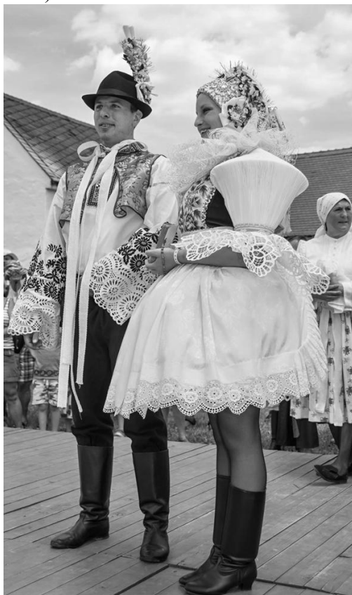
Vnorovský svatební pár, soubor Spinek

Volnou prohlídkou lidových trhů na náměstí jsme dospěli ke skanzenu a do jeho sekce hornáckých staveb, kde nás okouzlili svatebčané z Veselska v nádherných krojích (při třicítce stupňů Celsia), kteří v téměř celodenním časovém harmonogramu přibližovali návštěvníkům svatební den v podobě, jakou měl asi před sto lety: