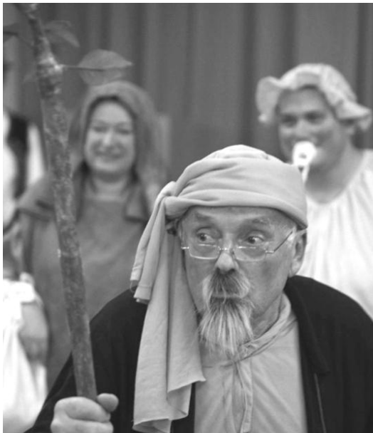
Vánoce v Krúžku