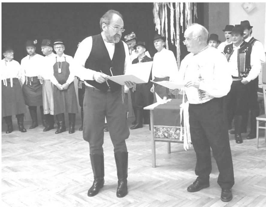
Hody z Hanáckého Slovácka v Orlovně Obřany