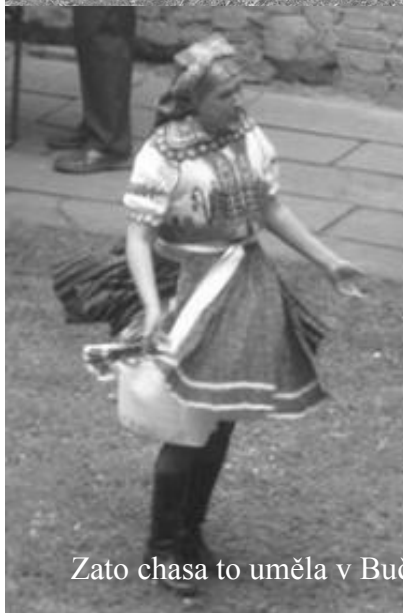
Zato chasa to uměla v Bučovicích pěkně roztočit!